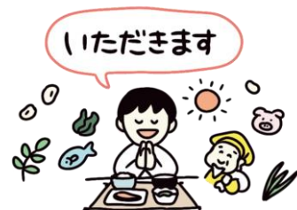
料理の食材となった自然の恵みへの感謝 神々やご先祖様への感謝

昔から、自然に寄り添い、深く関わってきた日本人は「いただきます」「ごちそうさま」を大切にしています。誰もが最初は大人のマネをして覚える言葉ですが、少しずつ周囲の大人から意味があることを伝えられることで、心からの「感謝の気持ち」がこもった挨拶ができるようになります。