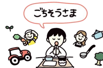
料理を作ってくれた人だけでなく、 関わってくれたあらゆる人への感謝